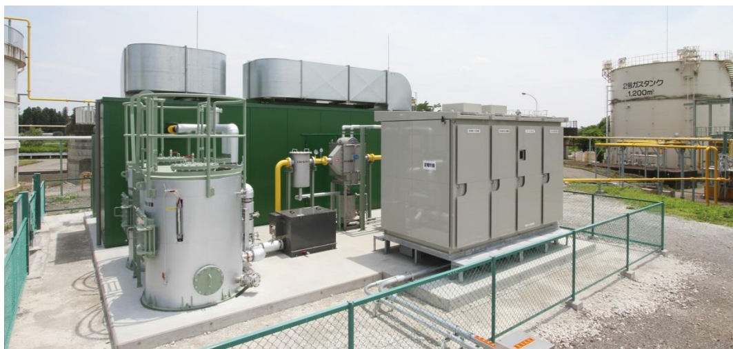
■鹿沼市黒川消化ガス発電所