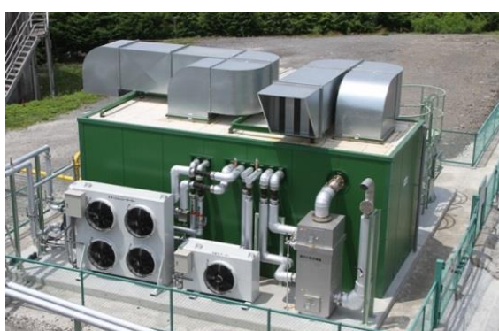
■ガスエンジン外観